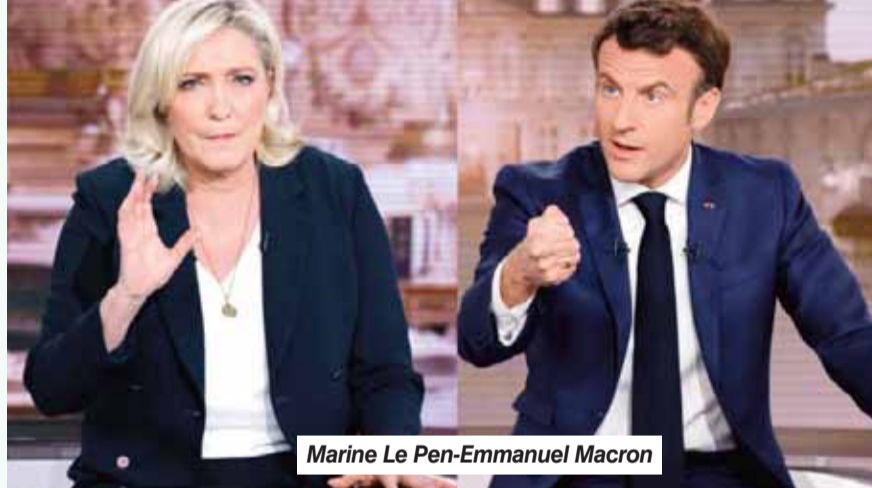
Marine Le Pen-Emmanuel Macron

2017 cumhurbaşkanlığı seçimlerinde uçlardaki bu iki aday favori durumundaydı. Sistemin efendileri, Cumhuriyetçiler ve Sosyalist Partinin yönetici kadrolarının desteği ile "aşırı sağ ve aşırı sol" diye nitelendirdikleri bu iki adayın karşısına Macron'u çıkardılar. Aday olduğunda Macron'un bir partisi bile yoktu. Kendisini hem sosyal demokrat hem de liberal olarak tanıtırdu. Muhafazakâr Liberaller ve