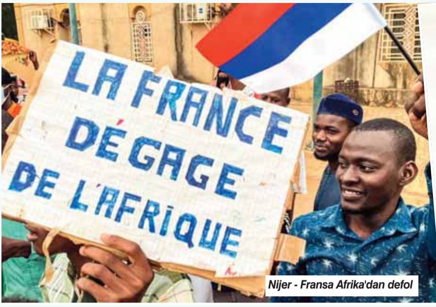
Nijer - Fransa Afrika'dan defol