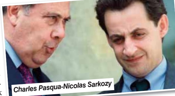
Charles Pasqua-Nicolas Sarkozy

9 Eylül 1986 tarihinde İçişleri Bakanı Charles Pasqua tarafından önerilen yabancıların ülkeye giriş ve ikamet koşullarına ilişkin yasa kabul edildi ve valilere düzensiz göçmenlerin sınır dışı etme yetkisi verildi. 1993'te kurulan sağ Edouard Balladur hükümetinde Charles Pasqua yeniden İçişleri bakanı oldu. Pasqua bıraktığı yerden devam ederek