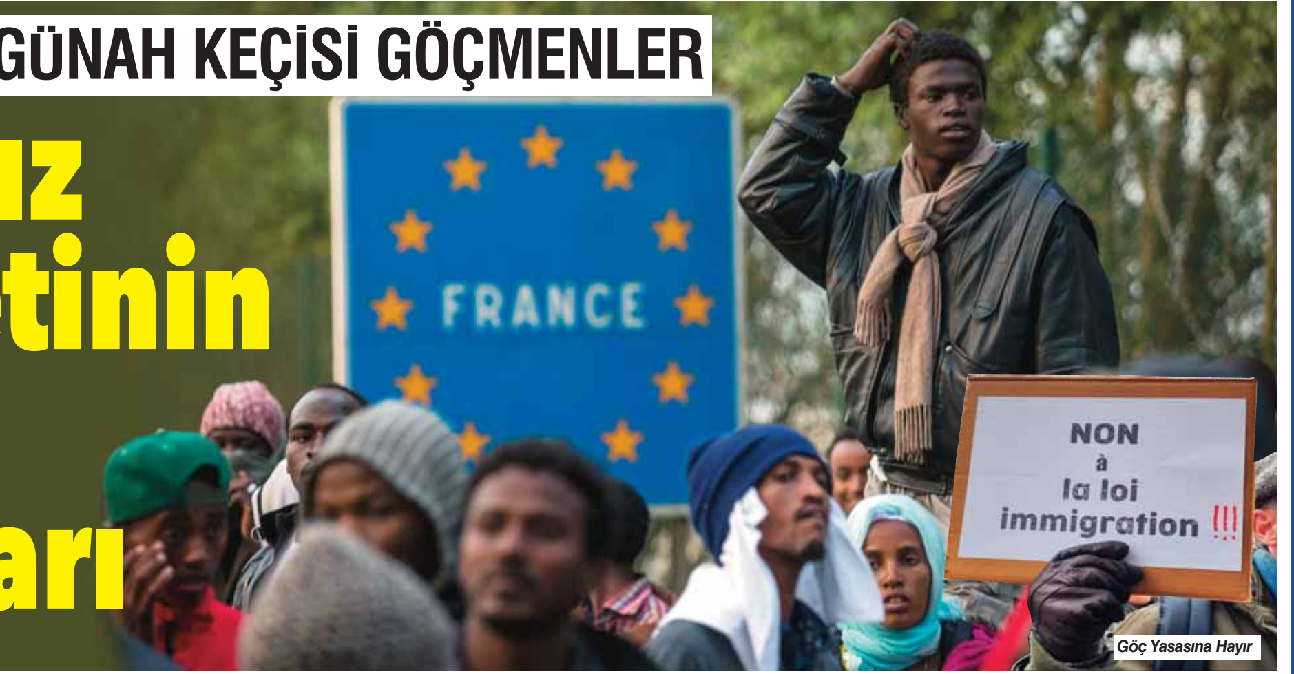
Göç Yasasına Hayır