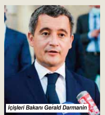
İçişleri Bakanı Gerald Darmanin

Yabancı göçünün kontrol altına alınması Cumhurbaşkanı Macron'un 2022 Cumhurbaşkanlığı seçim kampanyasının vaatleri arasındaydı. Fransız devleti açısından göçmenler "sorun" olmaya devam ediyordu. Aralık 2023'te yeni bir göç yasası kabul edildi.