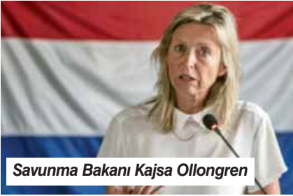
Savunma Bakanı Kajsja Ollongren

anlatmayı seçtik. Gerçekten de birkaç yıl öncesinden farklı bir zamanda yaşıyoruz. Güvenlik durumu dramatik bir şekilde kötüleşti. Amacımız Hollanda'da barış ve güvenliğin hafife alınmayacağı konusunda gençleri bilinçlendirmektir. Her Hollandalı bu sorumluluğu kalbine yerleştirmeli. Gençlere gönderilen mektup çok anlamlı.