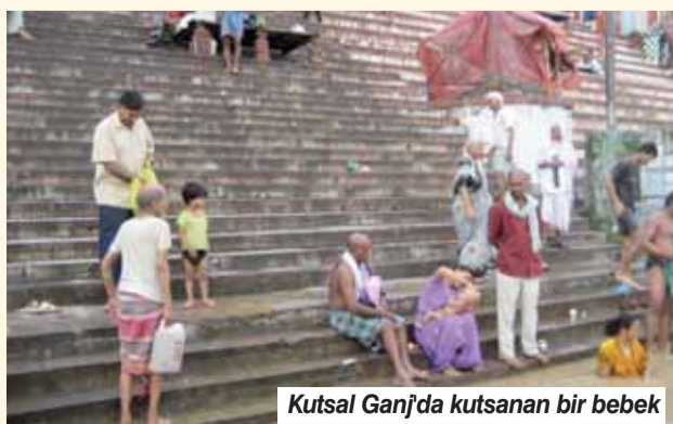
Kutsal Ganj'da kutsanan bir bebek

RUHLARI özgürleştirmek masraflı bir iş! Yanık et kokusunu engelleyen sandal ağacı uzaklardan getirildiği için pahalı. Bu yüzden sadece hali vakti yerinde sandal ağacı odunu alabiliyor. Diğerleriysa kenarlarda sıralanmış vasıfsız odunlardan satın alıyor. Yaklaşık 3 saat süren bir yakma işleminde 300-350 kg odun kullanılıyor. Belediyenin yoksullar için yaptırdığı, ücretsiz yakma firmına pek rağbet edilmediğini öğreniyoruz. Yakılma sırası o kadar kalabalık ki 24 saat yakma işlemi yapıldığını öğreniyoruz. Küller ya Ganj'a süpürülüyor veya bir kovaıyla suya dökülüyor, tabii yanmadan kalan parçalar da.