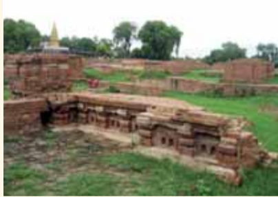
BUDİSTLER SARNATH'TA HACI OLUYOR

Budistlerin kutsal merkezi Sarnath, Varanasi'ye 10 km uzaklıkta ve çok dinlendirici yemeşil bir yer. MÖ 556 yılında Himalayalarda Lumbini'de doğan Buda, 18 yaşında aydınlanma yürüyüşüne başlamış. Bastığı yerlerde açan lotus çiçekleri arasında Bodhi Ganga'ya kadar yürümüş ve aydınlanmış. Buda'nın bilgeliğini ilk kabul edenler Sarnath'da yaşayan Ashok kavmi olmuş. Buda aydınlanmasını burada tamamlamış, fikirlerini burada yaymaya başlamış. Ashok'lar zaman içerisinde kaybolmuşlar ama Sarnath'ın kutsallığı devam ediyor! Eski ta-