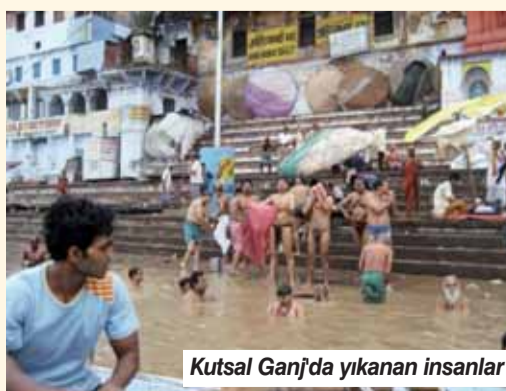
Kutsal Ganj'da yıkanan insanlar