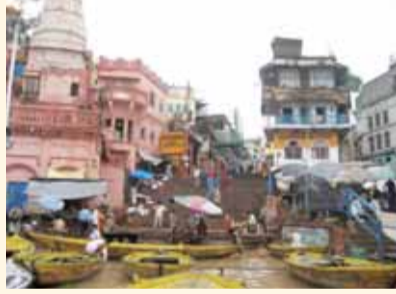
ŞAFAKTA 'GHAT' GEZİNTİSİ

Şafak vakti Varanasi'nin yarı karanlık çamurlu dar sokaklarda ilerlerken yol kenarında kırılıp uyumsuz yoksullar, çöp öbekleri arasında yiyecek arayan inekler, domuzlar, maymunlar ve köpeklerle karşılaşırız. Erkenki turistlere bir şeyler satmak umuduyla dolaşan seyyar satıcılar dışında sokaklar henüz sakin. Kısa kütük gibi ayakların üzerinde büyük boy ayakkabı kutusu gibi sıra sıra duran küçük dükkanların yanından geçerken aralanan kapılardan dışarı çıkan uyku mahmuru insanları görünce bazı dükkanların ev gibi kullandığını anlıyoruz. Belki başka evleri yok belki de ekme tekelerini koruyorlar! Sadu'lar dahi henüz uyku mahmuru! Ganj'a doğru inen sokaklara hareketlenmiş bile. Çıplak ayaklarıyla çamuru almadan yürüyen din adamları, sabahın ilk ışıklarıyla Ganj'in kutsal sularında yıkanmaya koşan insanlar, ölülerini ve hastalarını bambu sedyede omuzlarında taşıyarak Ganj'a ulaştırmaya çalışanlar, turistler, hep birlikte daracık sokaklarda ilerliyoruz. Nihayet Ganj kıyısında bir "ghat" ulaştık. Çocuk yaşta iki zayıf ve genç küreğçinin çektiği bir sandala biniyoruz.