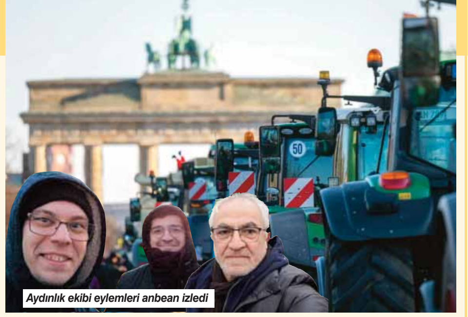
Aydınlik ekibi eylemleri anbean izledi

Konusurken isimlerini vermekten çoğu zaman kaçınan çiftçiler, Alman basınının sürekli yaptığı çarpıtmalara karşı tepkili oldukları için böyle davrandıklarını ifade ettiler. Bu nedenle çiftçilerin önemli bölümü basına güvenmiyor ve konuşmak istemiyor. İsmi vermek istemeyen bir çiftçi ise Alman basınında çıkan haberlere yönelik öfkelerini şu sözlerle dile getirdi: "Yaşadığımız sorunlara gözlerini kapatıyorlar. Siyasetçilerin çözüm üretmediklerini görmek istemiyorlar. Sonra biz hükümetin istifasını savununca aşırı sağcı, ırkçı olarak etiketleniyoruz. Ne dersek diyelim, basın sözlerimizi çarpıtıyor. Bu sebeple onlara konuşmak istemiyoruz."