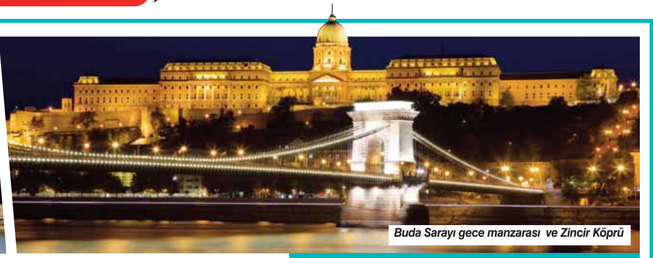
Buda Sarayı gece manzarası ve Zincir Köprü