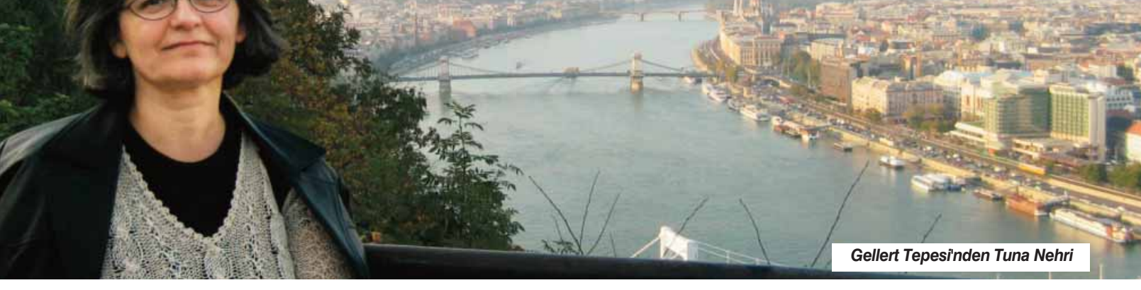
Gellert Tepes'inden Tuna Nehri