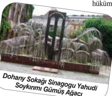
Dohany Sokağı Sinagogu Yahudi Soykırım Gümüş Ağacı

kurulan Budapeşte Türk Şehitliği'nde yatmakta. Budapeşte'de az sayıda Osmanlı eseri kalmış. Sadecce çeşitli izleri görmek mümkün, o kadar. Kökü Orta Asya'ya uzanan dil ak-