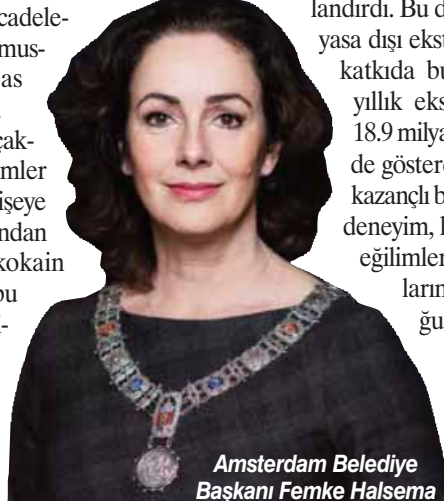
Amsterdam Belediye Başkanı Femke Halsema

Uyuşturucu kaçakçılığındaki son eğilimler bir başka ciddi endişeye yol açmıştır. 14 yaşından küçük çocuklar "kokain kuryeleri" olarak bu yasa dışı ticaretin içine çekilmektedir. Ele geçirilen miktarlar arttıkça şiddet de artmaktadır. Geçtiğimiz beş yıl