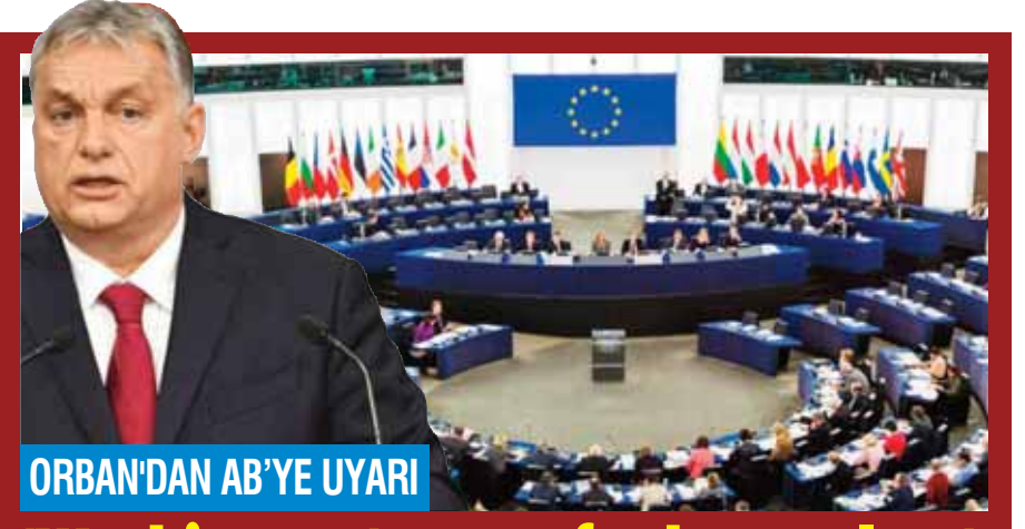
ORBAN'DAN AB'YE UYARI