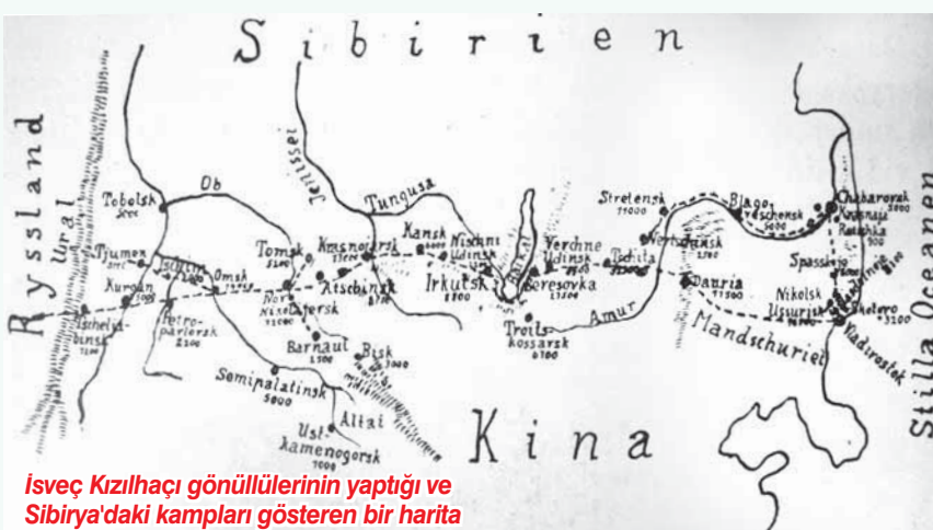
İsveç Kızılhaçı gönüllülerinin yaptığı ve Sibirya'daki kampları gösteren bir harita

* Bu yazı Tülin Uygur'un "Birinci Dünya Savaşı'nda Esir Türkler, Kaynak Yayınları, Ocak 2015" kitabı temel alınarak hazırlanmıştır.