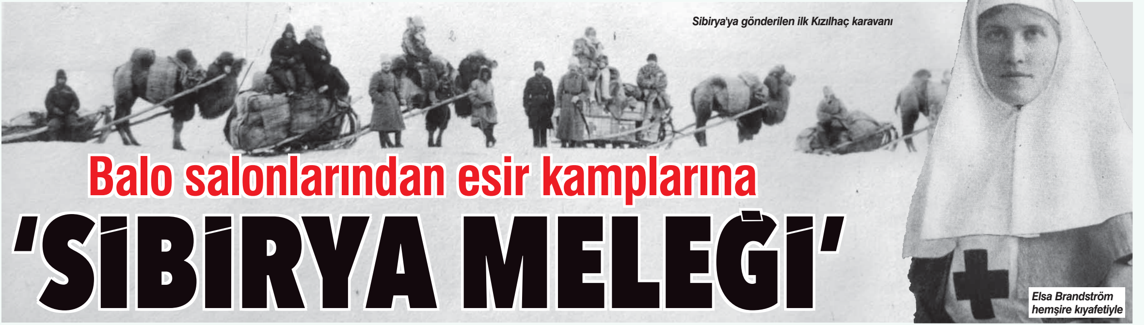
Sibirya'ya gönderilen ilk Kızılhaç karavanı