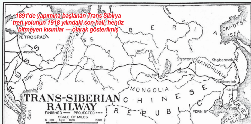
1891'de yapımına başlanan Trans Sibirya tren yolunun 1918 yılındaki son hali; henüz bitmeyen kısımlar --- olarak gösterilmiştir