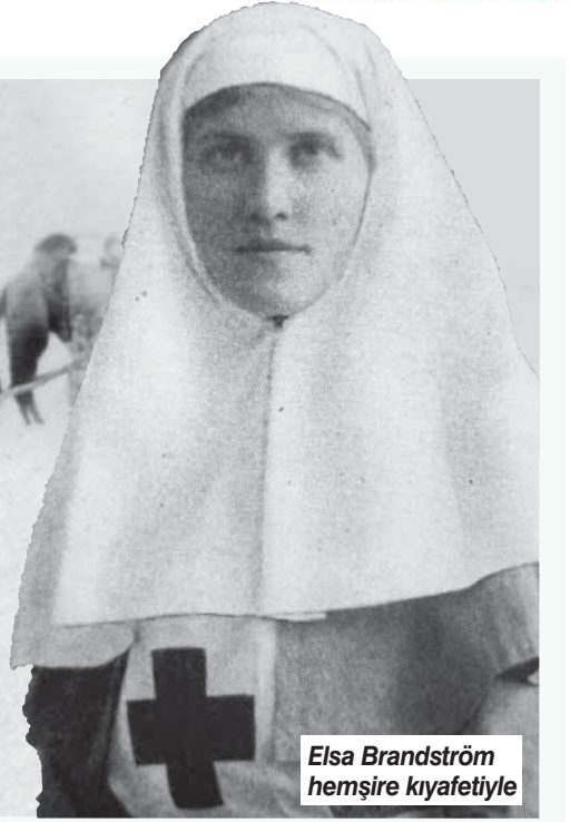
Elsa Brändström hemşire kıyafetiyle