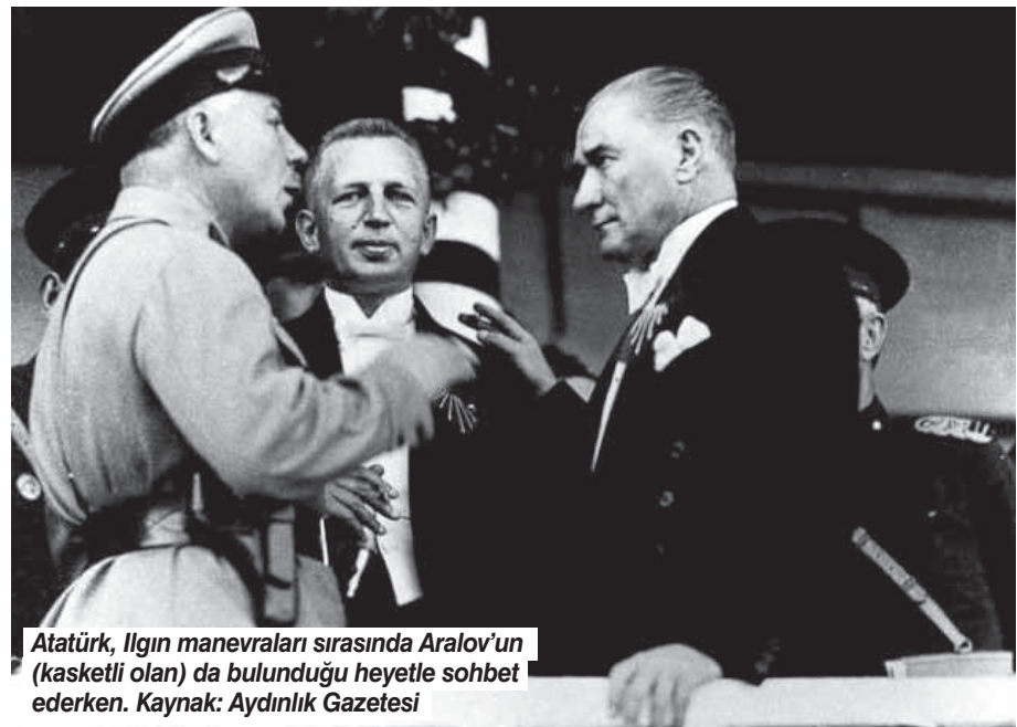
Atatürk, Ilgın manevraları sırasında Aralov'un (kasketli olan) da bulunduğu heyetle sohbet ederken.