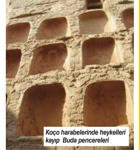
Koço harabelerinde heykelleri kayıp Buda pencereleri

ğni duyduk. Minareye inat, cami son derece sade yapılmış, tavanı taşıyan tahta direkler var, alçak kubbesi de farklı. Camiye girişi sağlanan dehlizdeki kapıların derinliği sonsuzluk hissi uyandırıyor