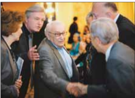
Compact Dergisi tarafından 2014 yılında Rusya ile ilgili bir konferans düzenlenmişti. Berlin'deki etkinliğin konuşmacıları arasında Eski Şansölye Danışmanı Egon Bahr da vardı.