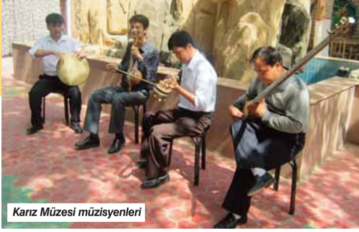
Karız Müzesi müzisyenleri