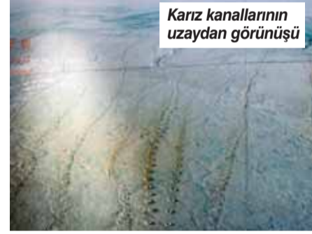
Karız kanallarının uzaydan görünüşü