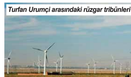
Turfan Urumçi arasındaki rüzgar tribünleri tarlası

Urumçi -Turfan arası yaklaşık 180 km, 3 saat sürüyor. Yol boyunca Tann dağlarının karlı tepelerini, coşkun akan nehirleri, kumulları, tuz göllerini seyrederiz. Hızlı tren için yapılan yüzlerce viyadük görüyoruz. Bu arada göz alabilirdiğince uzanan rüzgar enerjisi tribünleri ve tarlalara yayılmış güneş panellerini de