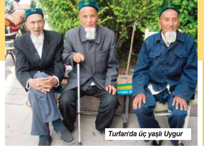
Turfan'da üç yaşlı Uygur