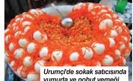
Urumçi'de sokak satıcısında yumurta ve nohut yemeği

Dışarıda Kapalıçarşı yakınlarında Türkiye'den oralarda ticaret yapmaya giden irili ufaklı firmalar gözümüze çarpıyor. Etrafta bolca pasaj ve oralarda da irili ufaklı mağazalar var. Bolca türban, "İslami giysi" ve hac malzemeleri, kitaplar gibi dini içerikli ürünler satan dükkanlar dikkat çekiyor. Hotanlı olduğunu öğrendiğimiz kapkara burkalar (tepeden turnağa simsiyah, göz olması gereken yerleri peçeli çarşaf) giymiş kadınların kocalarının ardından yürüdüğünü görmek bizi şaşırtıyor. Çin'in din tüccarlarına karşı takındığı hassas tutumu anlamakta zorlanmıyoruz.