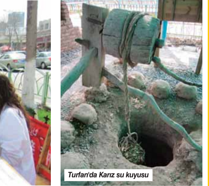
Turfan'da Karız su kuyusu

unutmadan yazalım. Böylesine yoğun bir alternatif enerji yatırımı hiç görmemiştik.