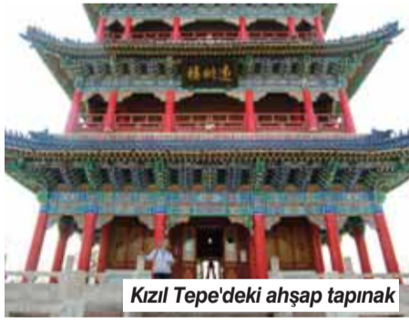
Kızıl Tepe'deki ahşap tapınak

Eski İpek Yolu üzerindeki Tarım havzasının çevresinde pek çok önemli tarihi kalıntılar var. Belli ki bölge her zaman önemli bir ticaret merkeziymiş. Bir İngiliz subay olan Francis Younghusband (1863-1942) 1887'de bölgeye gelmiş, araştırmalarını yapmış, ortağı kazmış, kazılarda gün yüzüne çıkardığı her şeyin resmini yapmış, fotoğraflarını çekmiş sonra da hepsini deve kervanına yükleyip götürmüştü. Hizmetlerinden dolayı da ülkesinde madalyayla ödüllendirilmiş.