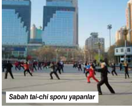
Sabah tai-chi sporu yapanlar

NE at sırtında dağları aşık ne de yollarca yollarda kaldık ama Batılı gezginlerin 19.yy ortalarında yaptığı keşif gezilerinin küçük bir bölümünü biz de yaptık. Eski gezinleri okuyup yazarken onlara çok önemmiş, deve kervanlarıyla yapılacak bir yolculuğu hayal etmiştik. Öyle olmadı. Kendimizi İstanbul'dan Urumçi'ye giden uçakta buluverdik. (1) 6 saat süren yolculuğun ardından Urumçi'ye indik. Saatlerimizi 5 saat ileri aldık. Artık Çin'in kuzey doğusunda Sincan Uygur Özerk Bölgesi'nin başkenti Urumçi'yi gezmeye hazırız.