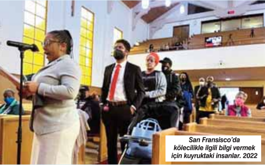
San Francisco'da kölecilikle ilgili bilgi vermek için kuyruktaki insanlar. 2022

“BU raporda 400 yılın ağırlığı var.” Isaac Bryan Kaliforniya Eyaleti ilk 1100 sayfalık kölecilik, ayrımcılık, ırkçılık tazminat raporunu ve bu noktadan sonra ne yapılacağı önerilerini yayınladı.