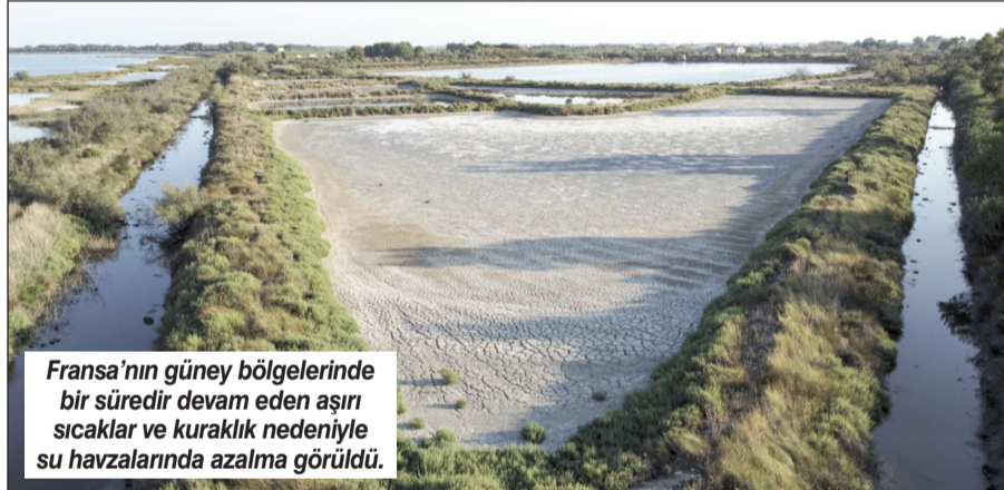
Fransa'nın güney bölgelerinde bir süredir devam eden aşırı sıcaklar ve kuraklık nedeniyle su havuzlarında azalma görüldü.

toplam 543 milyon kişiyi kapsayan 823 bölge için 2015-2022 yılları arasındaki sıcaklık ve ölüm verileri incelendi. Çalışmaya göre, geçen yıl 30 Mayıs ve 4 Eylül tarihleri arasında 61 bin 672 ölümün sıcaklarla bağlantılı olduğu ortaya çıktı. Araştırmada, özellikle 18-24 Temmuz haftasında ki yoğun sıcak hava dalgasının başı başına 11 bin 600'den fazla ölüme neden olduğu bilgisi yer aldı.