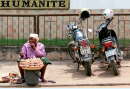
(Benin Porto-Novo müzesinde köleciliğe ilişkin bir anıt)