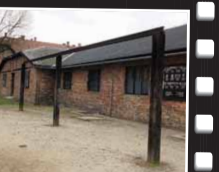
Auschwitz'deki toplu idam yapılan darağacı