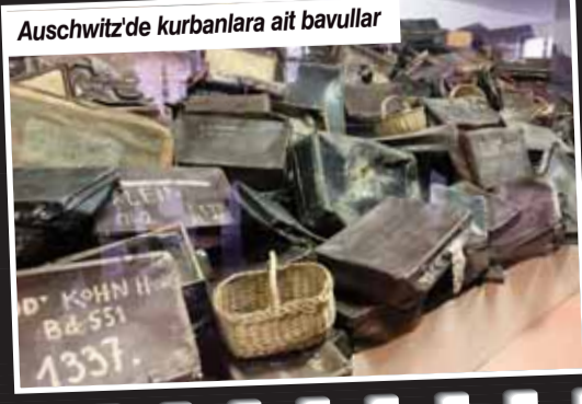
Auschwitz'de kurbanlara ait bavullar