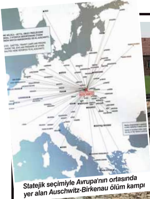
Statejik seçimiyle Avrupa'nın ortasında yer alan Auschwitz-Birkenau ölüm kampı