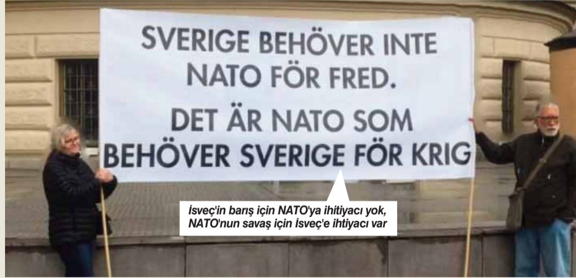
İsveç'in bars için NATO'ya ihtiyacı yok, NATO'nun savaş için İsveç'e ihtiyacı var

İsveç'in NATO'nun kilidini açacağına inandığı yeni terör yasası ABD'nin 11 Eylül saldırısından sonra tüm dünyada Müslüman örgütlere yönelik uyguladığı baskılar sonucu çıkarılmış gibidir. İsveç ceza kanununda yapılan düzenlemelerin İsveç'te 2021 sonu ve 2022 Paskalya döneminde Kuran yakma eylemlerine karşı yapılan protestolarda Müslüman ve göçmen gençler tarafından yapılan eylemlerden sonra yapıldığı görülmektedir. Hedef kitle olarak topluma sunulan ve protesto eylemlerine katılan gençlere ağırlaştırılmış cezalar verildiğini görmekteyiz. Buna karşılık Kuran yakma eylemlerini başlatan, meydanların savaş alanına çevrilmesine neden olan provokatör Paludan, İsveç yasalarına göre suç olan "başkalarının kutsalına hakaret etme" suçunu işlemesine rağmen "ifade özgürlüğü" klişesinin ardına sığınmış, eylemlerinin "ifade özgürlüğü" kapsamında olduğuna dair geniş destek bulmuş ve ona hiçbir cezai yaptırım uygulanmamıştır. Polis tarafından "toplumsal huzursuzluğa yol açacağı ve kısırtıcı olacağı gerekçesiyle bazı bölgelerdeki eylemlerinin yasaklanması olmasına rağmen mahkemeden aldığı onayla Kuran yakma eylemlerini yeniden başlatacağını duyurmuştur. Polis de mahkeme kararının ardından kendi tutumlarını yasalara göre gözden geçireceklerini belirt-