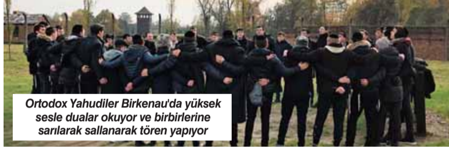
Ortodox Yahudiler Birkenau'da yüksek sesle dualar okuyor ve birbirlerine sarılarak sallanarak tören yapıyor

Auschwitz 1 ya da "Ana Kamp" 1940 yılında Almanların kurduğu ilk büyük toplama kampı oldu. İkinci kamp Auschwitz 2, 1941 yılında birinci kampın yaklaşık 3 km ötesinde Almanca Birkenau olarak bilinen Brzezinka köyünde kuruldu, en büyük kamp oldu. 1942'de Auschwitz 1'den 6,5 km öteye Almanca Monowitz denilen Monowice / Buna kampı ku-