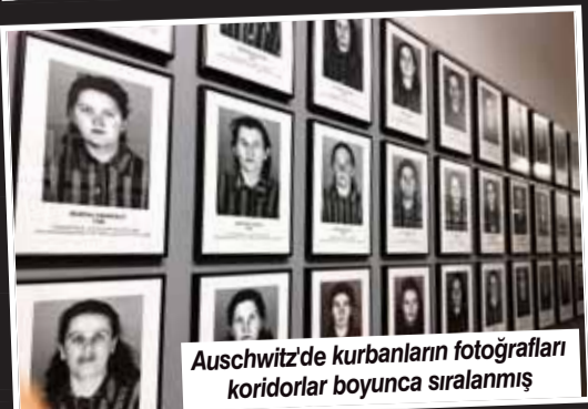
Auschwitz'de kurbanların fotoğrafları koridorlar boyunca sıralanmış