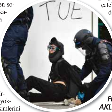
'EMPERYALİST FRANSA DEVLET AKLINI KAYBETTİ'

Bugün sorun göçmen sorunu değil. Bu sorun arka da kaldı. Ama Fransa göçmen sorununu da çözmemişti. Avrupa'da olduğu gibi Fransa'da da bolluk dönemi 70'lerde başlayan krizle birlikte sona ermiş ve krizin yol açtığı ekonomik ve sorunlar sosyal sorunları da beraberinde getirmişti. Artan işsizlik ve yoksulluk Fransa'nın alt kesimlerini derinden etkilemişti. Toplumda göçmenlere karşı tepkiler tavan yapmaya başlamıştı. Afrika'dan gelip Fransız'ın işini, ekmeğini "elinden alan" bu göçmenlere karşı ırkçı saldırılar çoğalırken, dönemin hükümetleri de göçmenleri banliyölerdeki gettolara hapsedmişti. 2000'li yıllar Fransa'da banliyö gençliğinin ailelerinin elinden kayıp gittiği, cihatçı örgütlerin ve uyuşturucu çetelerin eline düştüğü yıllardır.