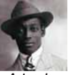
Anton de Kom (1924)

HOLLANDA hükümeti, 1 Temmuz 2023 tarihinde köleliğin fiilen sona ermesinin 150. yılına atıfta bulunarak Amsterdam Özgür Üniversitesi'nde (VU) Anton de Kom kürsüsü kuruyor. Anton de Kom'un rehabilitasyonuna katkı sağlama amacıyla hükümet, ailesi ve Anton de Kom Vakfı ile işbirliği ederek böylesi bir kürsünün kurulmasına karar verdi. Kürsü, Hollanda'nın kölelik geçmişinin tarihsel olarak işlenmesine ve bunun günümüze nasıl taşındığına odaklanıyor. Hükümet bu jestle Anton de Kom'un rehabilitasyonuna daha geniş bir kitle için somut ve görünür kılmak istiyor. Dışişleri Bakanlığı tarafından finanse edilen kürsü 2023-2024 akademik yılında başlayacak. Anton de Kom (22 Şubat 1898 - 24 Nisan 1945) Surinamli bir direniş savaşçısı ve sömürgecilik karşıtı bir yazardı. Surinam'da tutuklandı ve tutuklanmasına karşı yapılan protesto iki kişinin ölümlüye sonuçlandı. De Kom daha sonra Hollanda'ya sürgüne gönderildi ve burada sömürge karşıtı bir kitap olan Wif slaven van Suriname'yi ("Surinam'ın Biz Köleleri") yazdı. 2. Dünya Savaşı sırasında direnişe katıldı ve tutuklanarak Almanya'nın Sachsenhausen üzerindeki Neuengamme toplama kampına sürgün edildi. Sandbostel toplama kampının 24 Nisan 1945'te kurtarılmasından önce tüberkülozdan öldü.