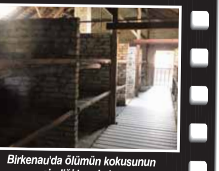
Birkenau'da ölümün kokusunun sindiği barakalar