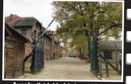
Auschwitz'deki giriş kapısı Arbeit Macht Frei Çalışma Özgürleştirir

3- 9 saatlik SHOAH belgesel filmini izleyiniz.