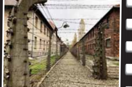
Auschwitz'de kaçışı engellemek için elektrik telleriyle çevrilmiş kamp binaları