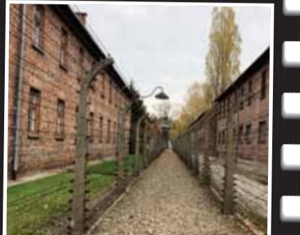
Ölüm, işkence, korku ve acı dolu kamp