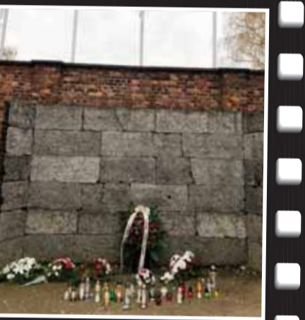
Auschwitz'deki ölüm duvarı, mahkûmların önünde kurşuna dizildiği duvar