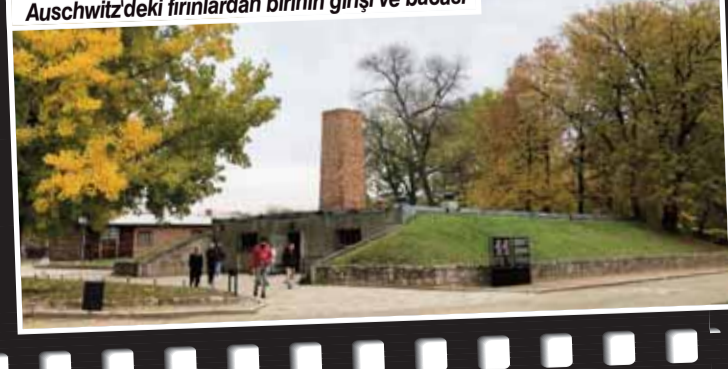
Auschwitz'deki fırınlardan birinin girişi ve bacası