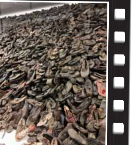
Auschwitz'de kurbanların ayakkabıları