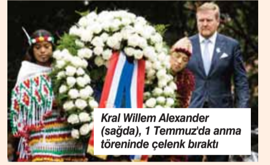
Kral Willem Alexander (sağda), 1 Temmuz'da anma töreninde çelenk bıraktı

Greve katılan öğretmenler, İngiltere Başbakanı Rishi Sunak ve Eğitim Bakanı Gillian Keegan'a çağrıda bulunarak, enflasyon karşısında adil ve makul ücret artışı talebinde bulundu.