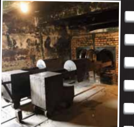
Nazilerin binlerce insanı yaktığı fırın bölümünden burada ziyaretçilerden sessizlik ve öldürülenlerin anısına saygı göstermeleri isteniyor