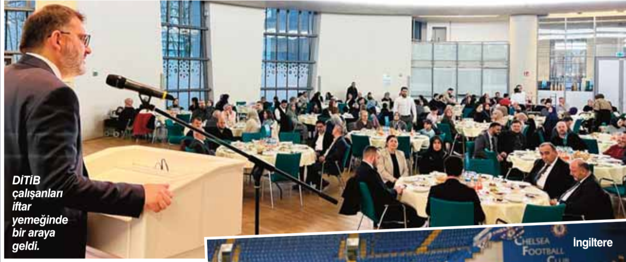
DİTİB çalışanları iftar yemeğinde bir araya geldi.

"Ramazan-ı Şerif Ayı Dayanışma Ayıdır" diyen DİTİB Genel Başkanı Dr. Muharem Kuzey, "Ramazan-ı Şerif ayına giriyoruz derken yüreklerimizi dağılayan bir hadiseyle karşı karşıya kaldık. Deprem ardından yaralarını sarmak için teşkilat olarak Almanya genelinde nakdi yardım kampanyası başlattık. Diyanet Vakfımızın koordinatörlüğünde yaklaşık bin konteyner konutumuzu şu anda yerleştirdik. Ramazan ayı bittinceye kadar en azından 2 bin 500 konteynerimizi daha bölgeye yerleştirmeyi hedefliyoruz. "İftarımı ve Sahurumu Kardeşimle Paylaşıyorum" temasıyla bölgedeki depremde kardeşlerimize iftar ve sahuruluklar hazırlamaya gayret gösterdik. Bunun çabası içerisindeyiz. Bölgeye giden gönüllü ekibimiz oradaki organizasyonları tamamladılar. Günlük 15 noktada yaklaşık 15 bin kardeşimiz ile iftar sofrasında lok-