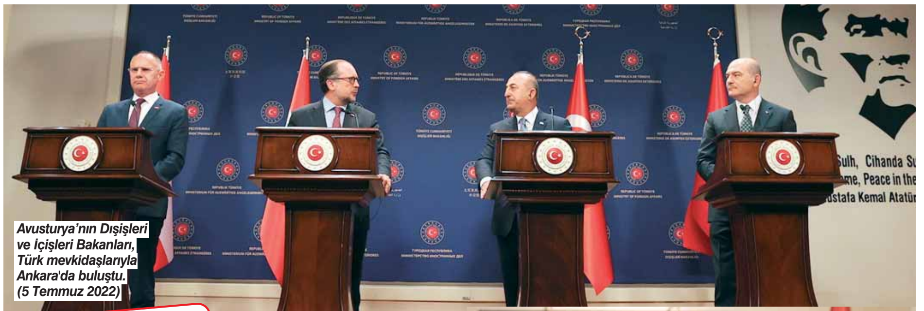
Avusturya'nın Dışişleri ve İçişleri Bakanları, Türk mevkidaşlarıyla Ankara'da buluştu. (5 Temmuz 2022)

Türkiye ile iyi ilişkilerin özellikle kriz sürecinde önemli olduğuna dikkat çekildiği haberde, Türkiye'nin İsveç ve Finlandiya'nın NATO üyeliği için kazanılmak istendiği hatırlatıldı. Türk Silahlı Kuvvetleri'nin NATO içindeki en büyük ikinci ordu olduğunun belirtildiği haberde Sobotka'nın bu nedenle diplomatik bir ağırlığa sahip olduğu vurgulandı. Haberde ayrıca Türkiye ile iyi ilişkilerin, enerji krizi karşısında daha da önem kazandığına dikkat çekildi. Avusturya'nın doğal gaz ihtiyacının yüzde 80'ini Rusya'dan sağladığını hatırlatıldığı haberde birçok önemli boru hattının Ukrayna'dan geçmesinin sorunlara yol açtığı, ancak Türkiye'den de çok sayıda boru hattı geçtiği vurgulandı. Siyasi alanda Türkiye'nin Rusya'nın yanı sıra Azerbaycan ve İran ile ilişkileri olduğunun ifade edildiği haberde, Avrupa'nın gelecekte-