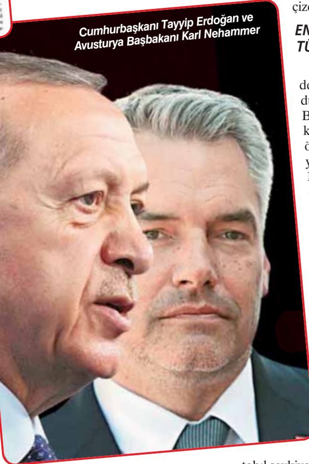
Cumhurbaşkanı Tayyip Erdoğan ve Avusturya Başbakanı Karl Nehammer

Yaklaşık bir yıl önce TBMM Başkanı Mustafa Şentop'un Viyana'da ağırlandığını hatırlatan Ceyhun, Avusturya Ulusal Konsey Başkanı Wolfgang Sobotka'nın düzenlediği yemeğe dönemin Avusturya Başbakanı Kurz'un da katıldığına işaret