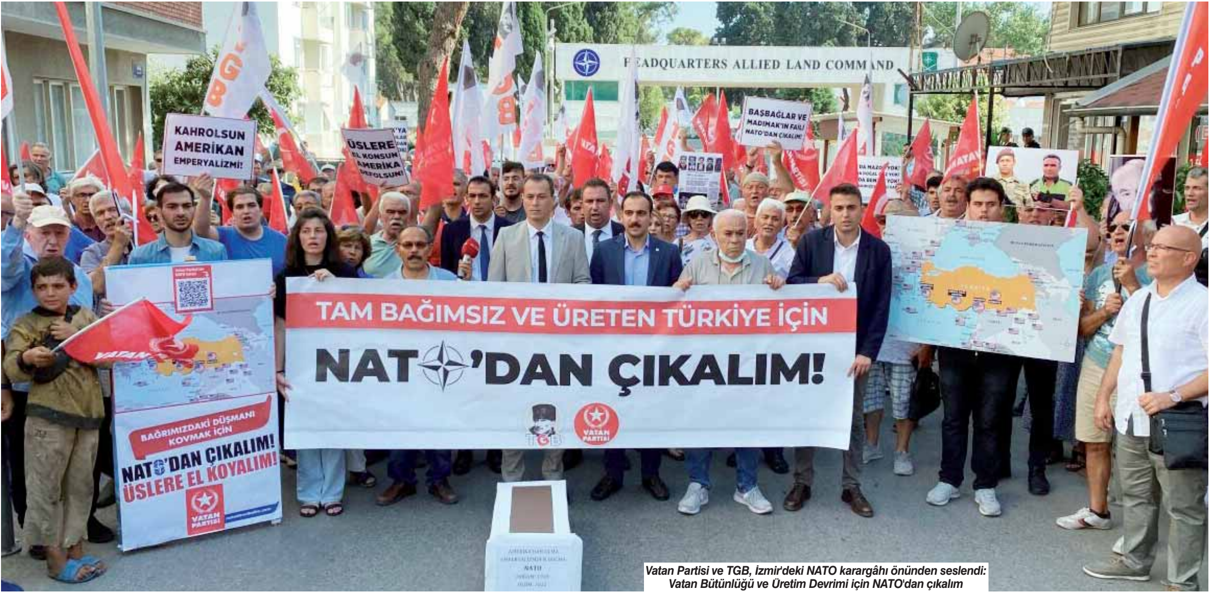
Vatan Partisi ve TGB, İzmir'deki NATO karargâhı önünden seslendi: Vatan Bütünlüğü ve Üretim Devrimi için NATO'dan Çıkalım