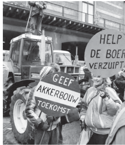
1989 yılında protestocu çiftçiler Tarım Bakanlığını işgal etti

litikandan da bir dezavantajı vardı. Tarım ürünlerinin yüksek fiyatları üretim fazlalığının satın alınmasına bağlı olduğundan, Avrupa tarım politikası 1980'lerden itibaren sürdürülemez hükümet harcamalarına yol açmıştır. Bu nedenle Lahey ve Brüksel'deki hükümetler tarım sektörüne verilen devlet desteğini azaltmaya karar verdi. Sonuç olarak, süt ürünleri ve tahıllar gibi tarımsal ürünlerin fiyatları önemli ölçüde düştü. Bu yeni hükümet politikası Hollandalı çiftçiler arasında geniş çaplı protesto eylemlerine yol açtı. Göstericiler güç aracı olarak genellikle traktörlerini kullandılar. 1 Mart 1989'da traktör alayı Lahey'deki Tarım Bakanlığı ve yakındaki Sosyal Ekonomik Konsey (SER) binalarının girişini kapattı. Eylemci çiftçiler SER'in binasına zorla girerek içeriye bezelye serptiler. Şubat 1990'da D66 üyesi bir milletvekili düşen tahıl fiyatlarına karşı bir önerge vermek istediğinde 600 kadar çiftçi yine traktörleriyle Lahey'e giderek Parlamento'nun önünde eylem düzenlediler.