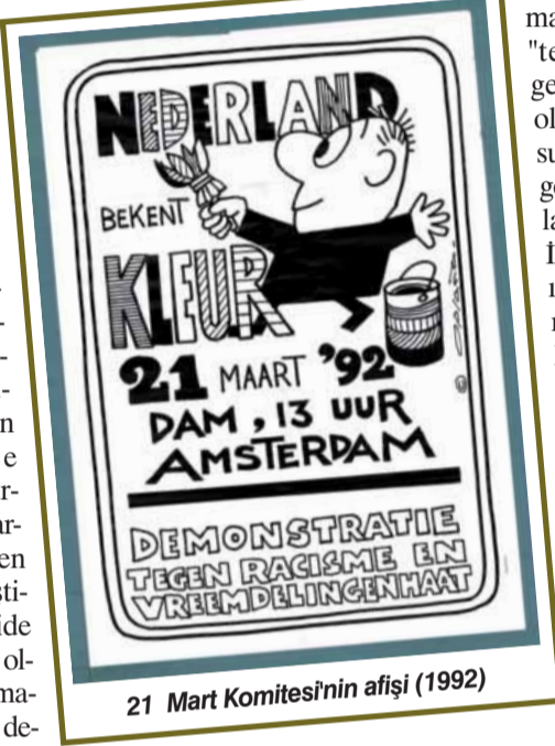
21 Mart Komitesi'nin afişi (1992)

Hollanda'nın geleneksel sosyalistleri, komünistleri ve sosyal demokratları neoliberalizme yenilmiş sol örneği sergileyerek, sosyalizm ideolojisinden, ilerici materyalist felsefeden uzaklaşmış, işçi sınıfı mücadelesine inancı sıfırlamış ve emek sömürsünü görmemek için sis perdesi oluşturarak, 20 yıldır sürekli sağa kayan Hollandalı seçmenin nabzına göre şerbet vermekte adeta yarış tutmaları ise madalyonunun diğer yüzü. 11 Eylül saldırıları ABD başta ol-