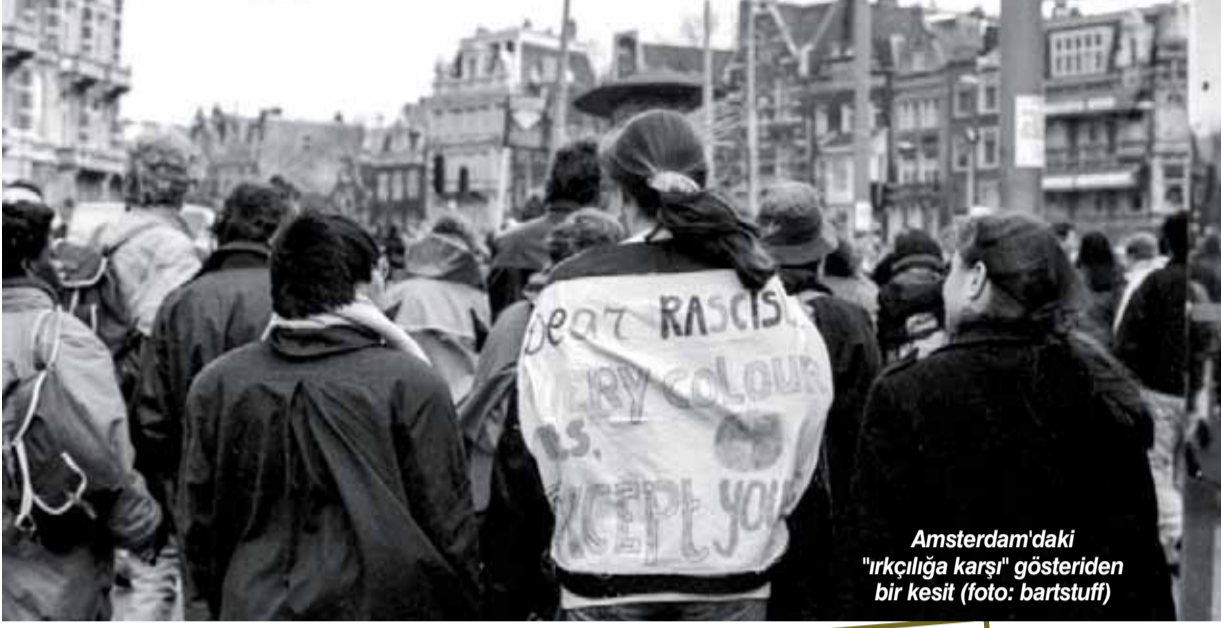
Amsterdam'daki "İrkçılığa karşı" gösteriden bir kesit

Hollanda Vergi İdaresi'nin bir bölümünde kurumsal ırkçılık yapıldığı bizzat Devlet Bakanı Marnix Van Rij'in Temsilciler Meclisine gönderdiği 9 sayfalık yazılı ile kabul edildi. İrkçilik karşısında tepkilerin olmaması ise gözlerden kaçmadı