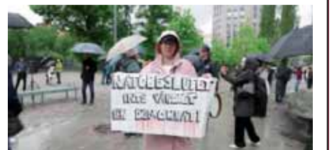
İsveç'in NATO üyeliği için çabaları sürerken ülkenin başkenti Stockholm'deki Fatbursparken meydanında bir grup, NATO karşıtı protesto gösterisi düzenledi.

Finlandiya Dışişleri Bakanı Pekka Haavisto ise son açıklamasında "Türkiye'nin bazı güvenlik endişelerini derinlemesine ele aldığımızı düşünüyorum. Ve tabii ki Türkiye ile bu diyalogu sürdürmeye hazırız" şeklinde konuştu.