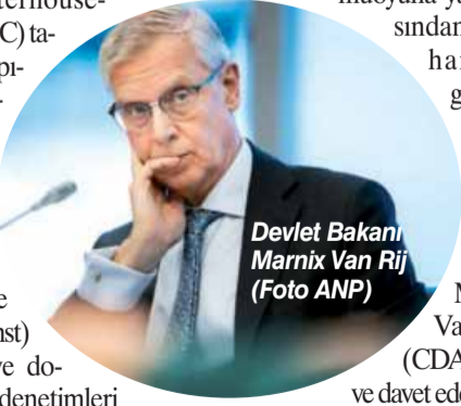
Devlet Bakanı Marnix Van Rij

30 Mayıs 2022 tarihinde Temsilciler Meclisine konu ile ilgili 9 sayfalık yazılı gönderen Devlet Bakanı Marnix Van Rij (CDA), Vergi İdaresi'nin bir bölümünde kurumsal ırkçılık yapıldığını kabul etti.