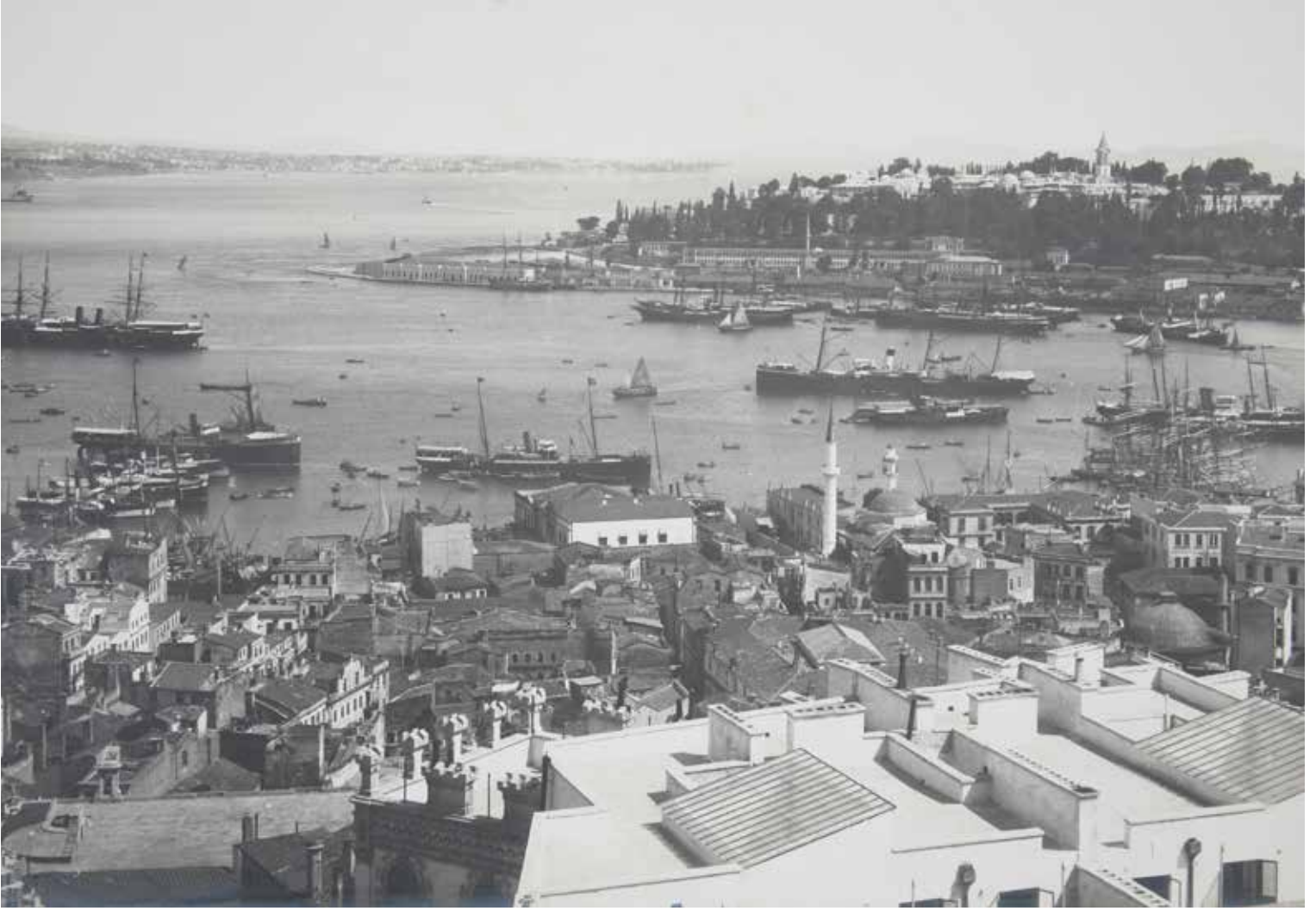
8- Galata'dan Sarayburnu ve Boğaz

XV. yüzyıllara kadar geri götürülebilirse de sonuçları ve şehirlere etkilerinin görülmesi açısından 1700'lü yıllar kritik eşik olarak ortaya çıkmaktadır.