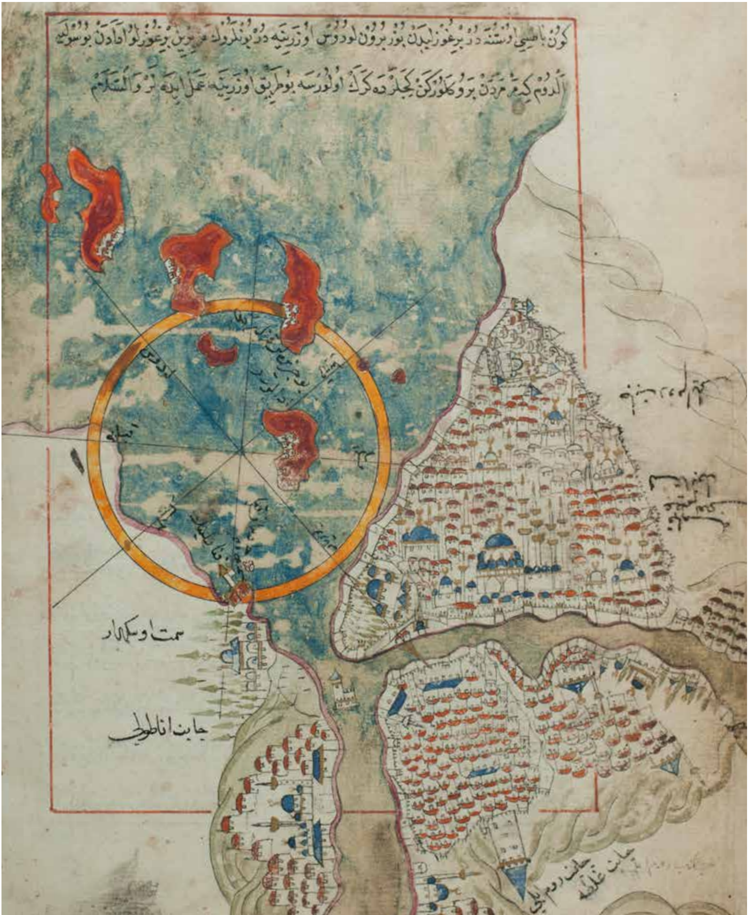
1- İstanbul (Piri Reis, Kitâb-ı Bahriye)