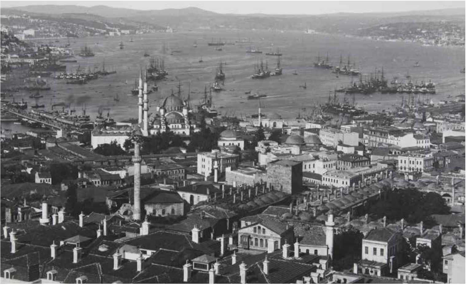
6- Yeni Cami çevresi ve Boğaz