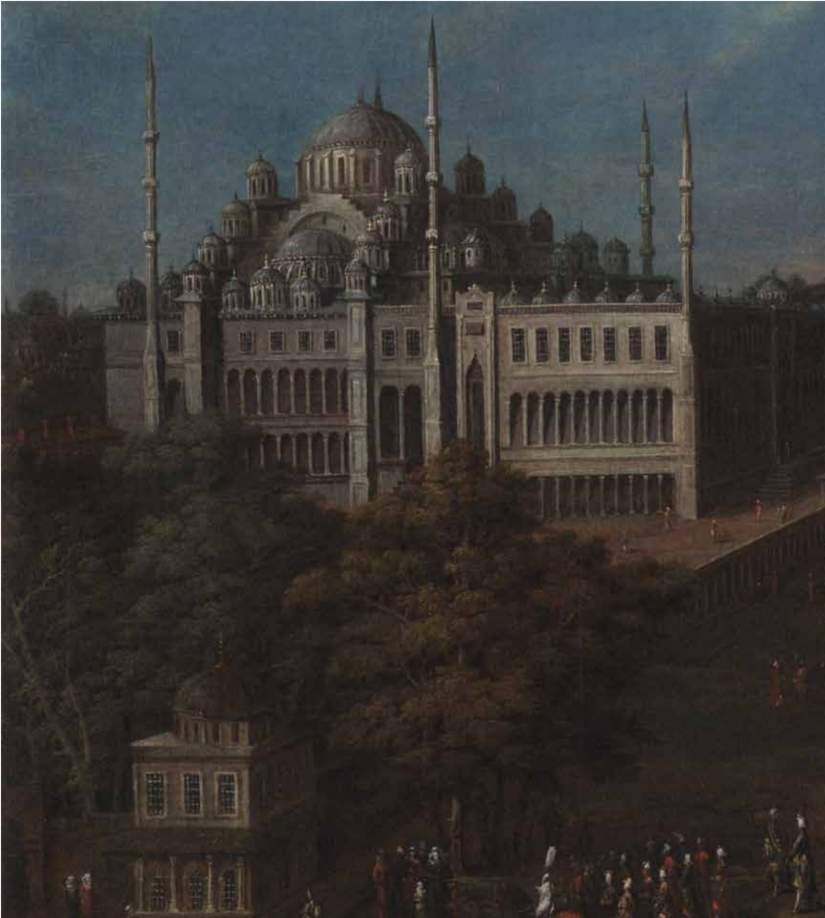
4- Sultanahmet Camii ve Meydanı (Amsterdam, Rijks Müzesi)