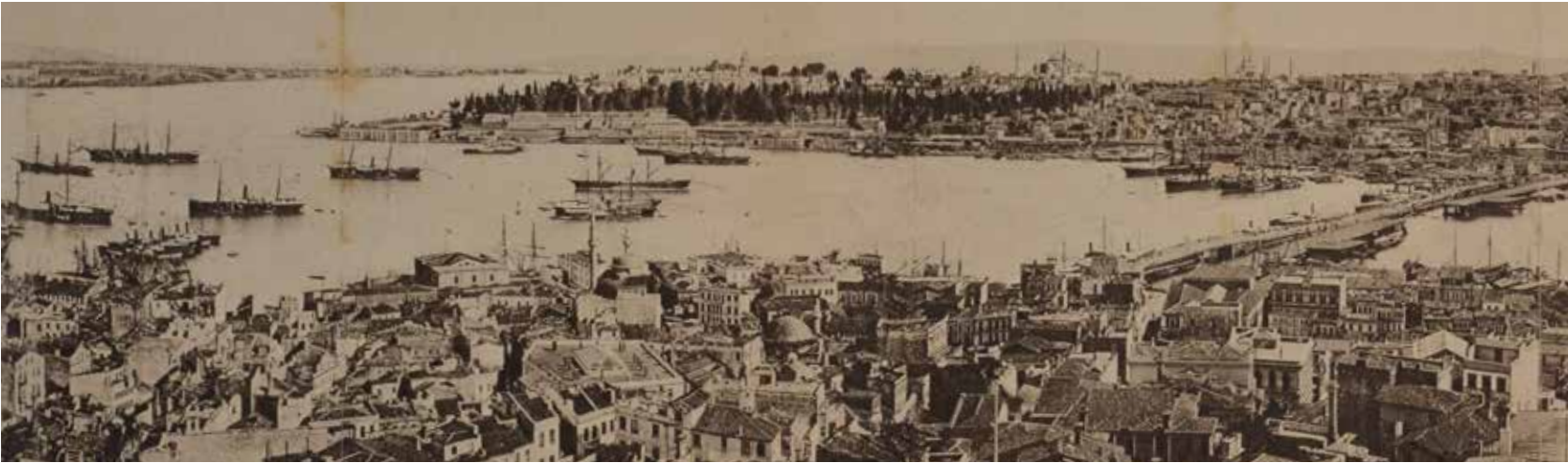
9- İstanbul panoraması: Üstte: Beyazıt'tan, eski İstanbul (Sultanahmet'ten Süleymaniye'ye), Haliç, Galata-Pera, Dolmabahçe, Üsküdar, Haydarpaşa, Marmara Denizi

şehir hariç, bu büyüklük Osmanlı şehirlerinin en az on katı kadardır. Nüfusun yapısı açısından ise nispeten daha çeşitli bir nüfusa sahip olmasına rağmen (yaklaşık olarak yarısı ya da biraz daha fazlası Müslüman ve kalanı çok farklı dinî ve etnik yapılarıdır) diğer Osmanlı şehirlerinde de benzer bir çeşitlilik ve birlikte yaşam kültürü vardır. Genel olarak Balkanlar'a ve Ege sahillerine gittikçe Müslüman-gayrimüslim oranı ikincisinin ve Anadolu'ya uzandıkça ise birincisinin lehine nüfus yapısı değişmektedir. XIX. yüzyıl sonuna kadar İstanbul'da bu oran dengeli bir yerde durmuş gözükmektedir.