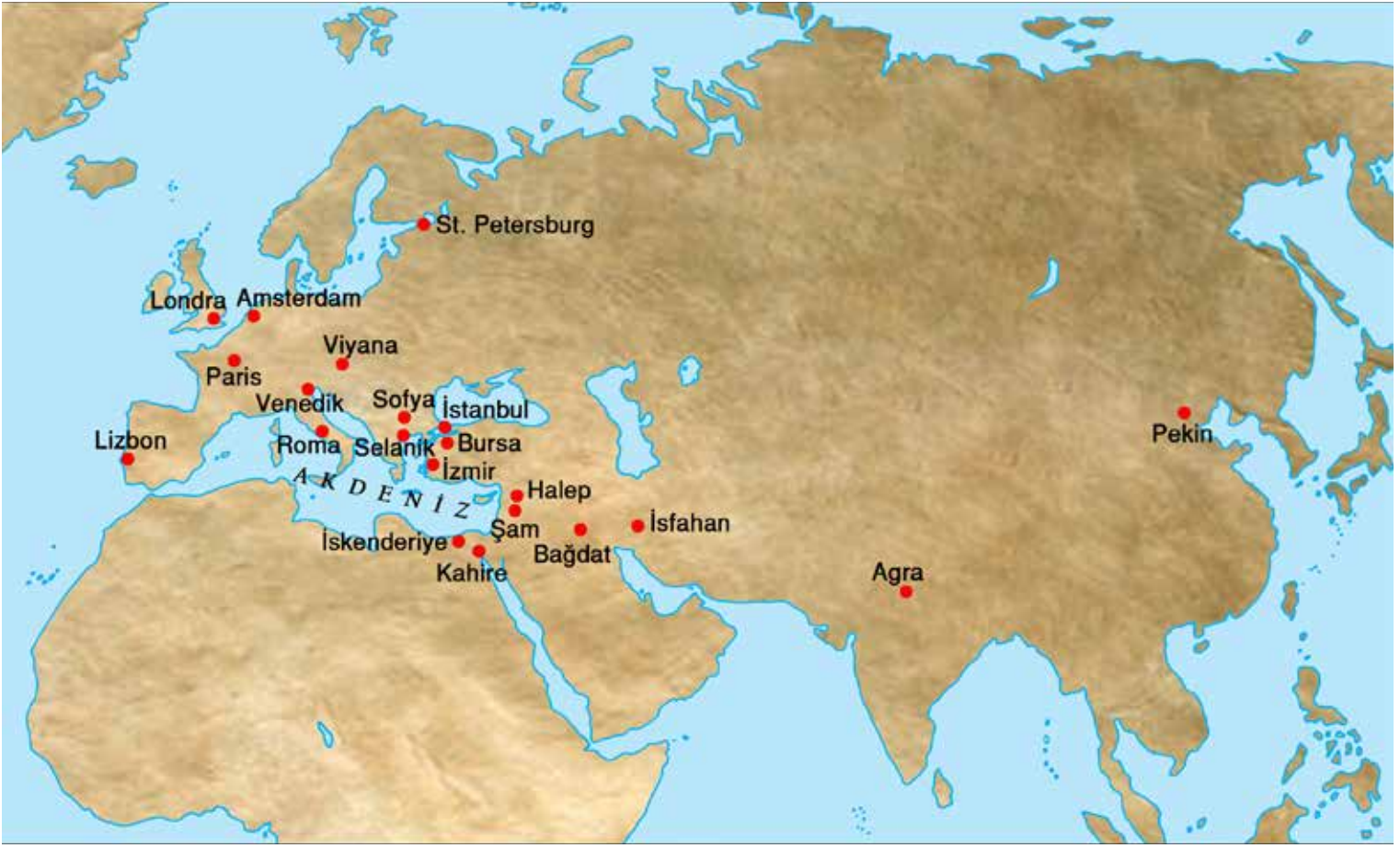
10- Osmanlı İstanbul'u ve dünya şehirleri (Harita: Oğuz Kallek)

buldukları coğrafyanın genel nüfus kalabalıkları ile göreceli olarak düşünüldüklerinde, durum daha iyi anlaşılır. İsfahan'ın nüfusunun 300.000-500.000 aralığında tahmin edildiği dönem olan 1650'lerde Agra ve İstanbul'un nüfusunun 500.000'in üzerinde olduğu bilinmektedir. Ayrıca, 1700'lerden sonra İsfahan ve Agra siyasi nüfus özelliklerini kaybederken İstanbul ise uzun başkentliğine devam edecektir. Delhi, Agra'nın ve Tahran, İsfahan'ın yerini XVIII-XIX. yüzyıllarda alarak İstanbul ile mukayese edilebilecek şehirler konumuna geçeceklerdir.