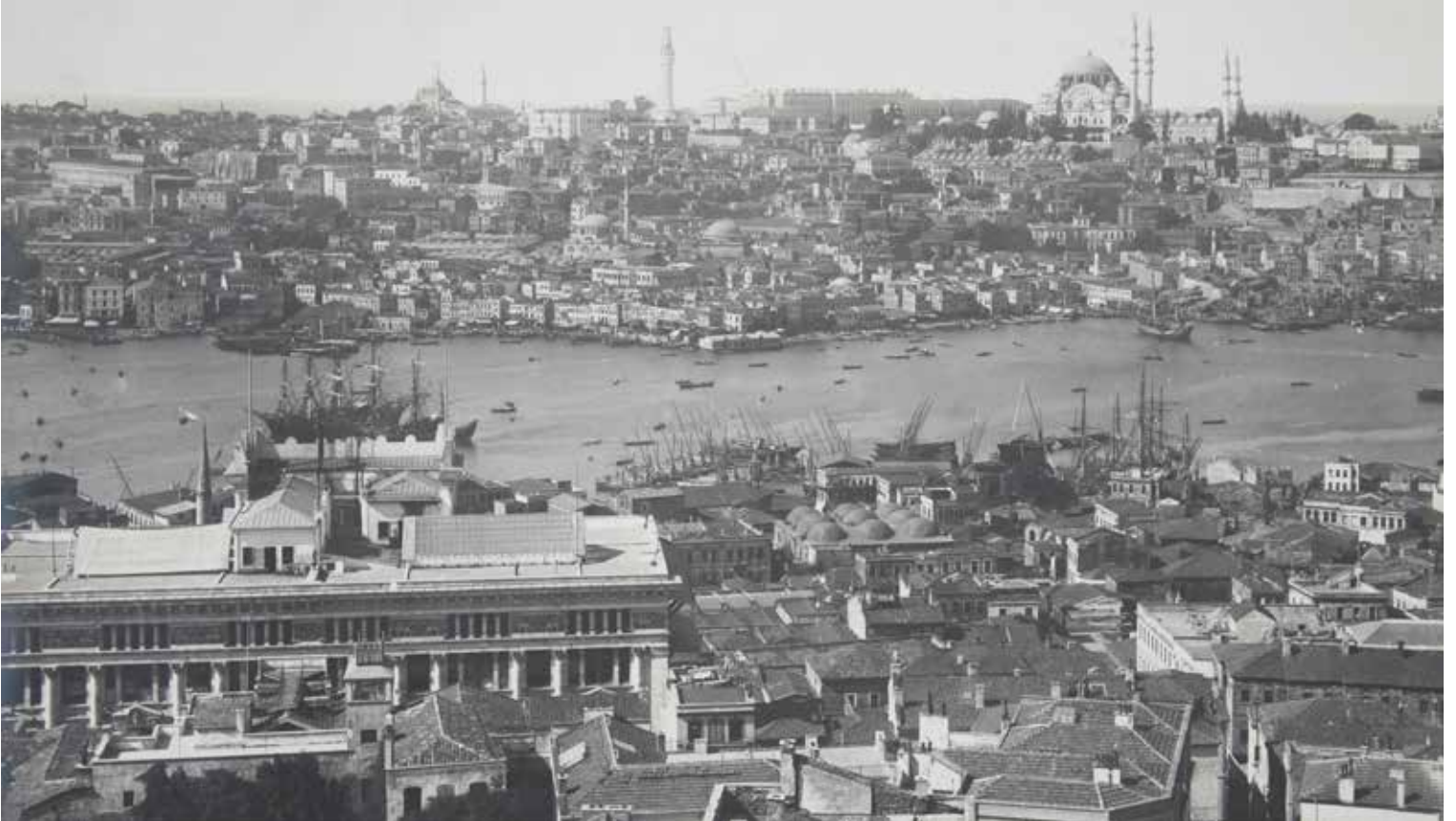
7- Haliç'in iki yakası