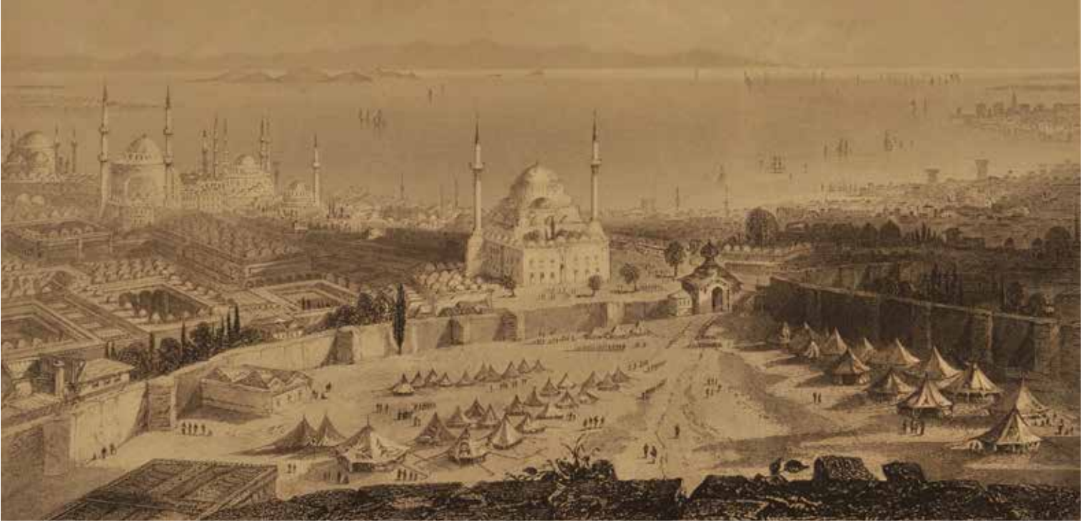
5- Beyazıt Yangın Kulesi'nden İstanbul ve Marmara (Pardeo)

ortaya konulmaya çalışıldı. Bu süreçler tespit edilirken kullanılan deliller daha çok imgesel ve tarihî kayıtlara dayandırıldı. Bir anlamda kendi iç-dış ilişkilerine bakarak şehre dünyada bir yer biçilmiş oldu. Şimdi detaylara inip bu tasavvuru biraz daha somutlaştırıp diğer şehirler çerçevesinde mukayeseli bir şekilde incelemek gerekmektedir. Mukayeseye konu olacak şehirleri belirlerken her iki dönemde İstanbul ile karşılaştırılması mümkün olan Osmanlı coğrafyasından ve diğer coğrafyalardan farklı şehirler seçildi. İnceleme ise karşılaştırılacak şehirler için ilk elden ulaşabilecek bilgiler hesap edilerek üç kriter üzerinden yapıldı. Birinci kriter şehrin topoğrafik ve yerleşim özellikleri yani coğrafi konumu, temel topoğrafik özellikleri ve iç yerleşim biçimidir. İkincisi şehirlerin demografik gelişimleri yani nüfus büyüklükleri, etnik ve dinî çeşitliliğidir ve son kriter ise şehirdeki mimari yatırımlar ve estetik değerleridir. Hemen ifade edilmelidir ki, burada verilen her türlü rakamsal bilgiler yani şehirlerin alan büyüklükleri, nüfus toplamları çeşitli kaynaklardan elde edilen tahminlerdir; kesin bilgiler değildir. Özellikle nüfus tahminleri, ilk el kaynaklardaki çok değişken bilgiler ya da ipuçları arasından en makul bir şekilde yapılmaya çalışılmıştır.