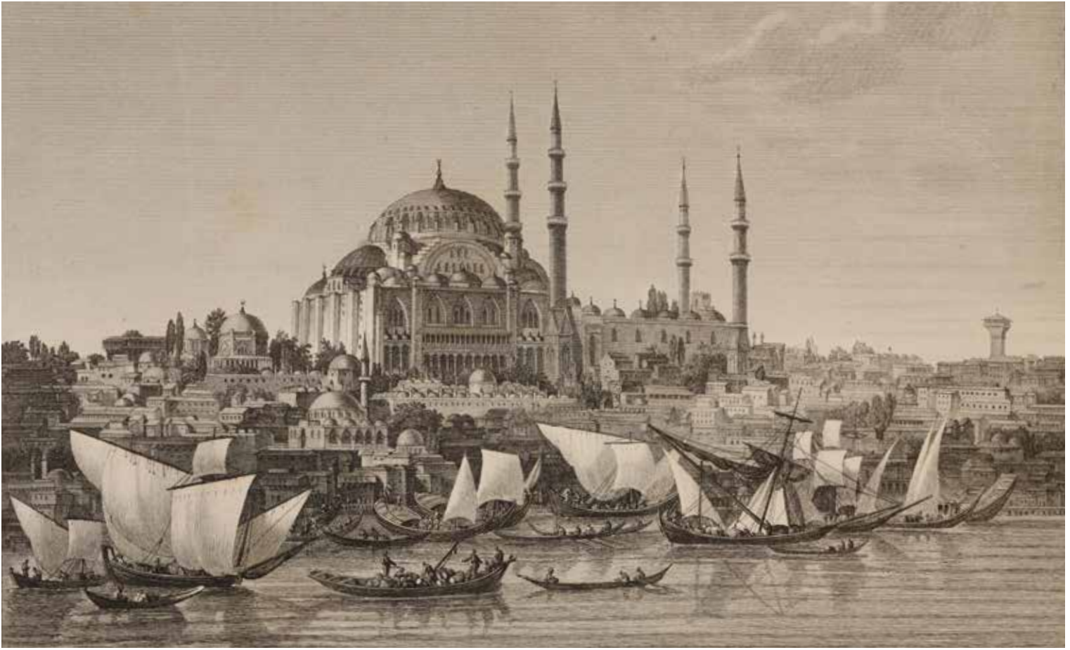
3- Süleymaniye Camii ve çevresi (Gouffier)

başkent olmuştur. Nitekim, XVI-XVII. yüzyıllarda dünyada Pax Ottomana'nın (Osmanlı Barışı) teşekkül etmesi böyle bir başkent ile mümkün hâle gelmiştir.