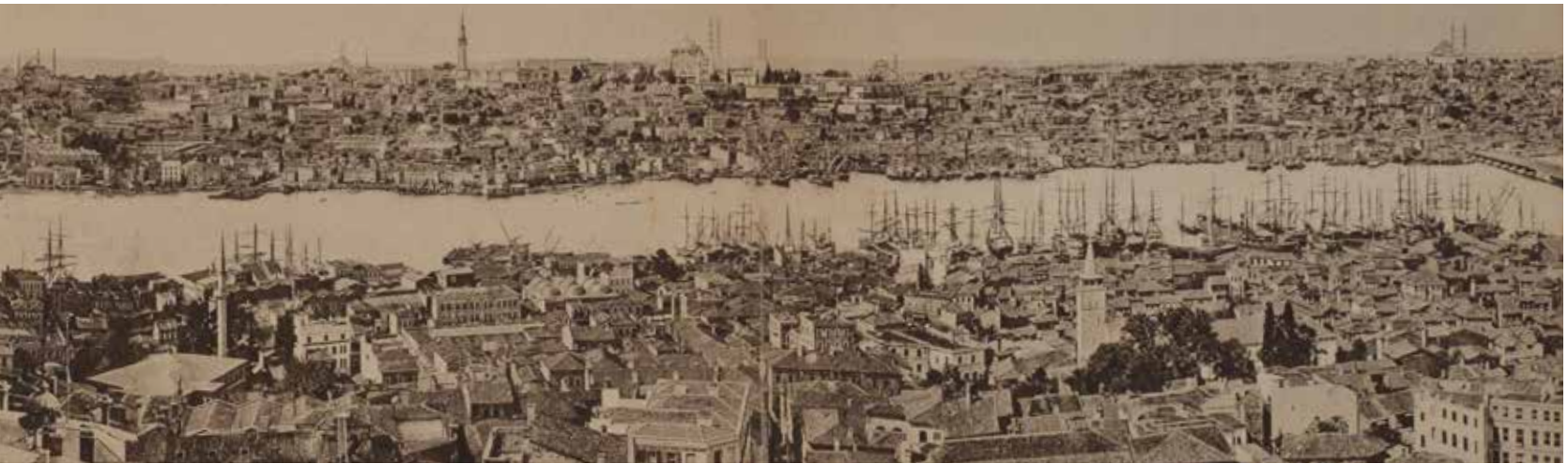
Alta: Galata'dan Haydarpaşa, Topkapı Sarayı, Ayasofya, Sultanahmet, Nuruosmaniye, Beyazıt Camii, Beyazıt Yangın Kulesi, Süleymaniye ve Fatih Camii'ne kadar Fatih semti (Diez-Glück)

Adriyatik ve Akdeniz ticaretini elinde tutan diğer önemli bir şehirdir. İstanbul ile özellikle Bizans zamanında çok büyük ticaret yapan Venedikliler, Osmanlılarla girdikleri güç mücadeleleri ile Akdeniz'deki eski nüfuzlarını kaybetmişler, coğrafi keşiflerin sonucunda da Atlantik ağına dâhil olan şehirlere gücünü emanet etmişlerdir. Venedik, 1600'lerde sahip olduğu 150.000 kadar nüfusu ile yine de bir ada şehir olarak tarih boyunca önemini hep muhafaza etmiştir. Jeostratejik olarak İstanbul'a çok benzeyen bu şehir, özellikle X-XV. asırlar arasında İstanbul ile ya ortak ya da rakip olarak başa baş gitmiş sonraki yüzyıllarda ise İstanbul'un birçok açıdan gerisinde kalmıştır. 1900 yılları başlarında 2.000.000'lük nüfusu ile Avrupa'nın Londra, Paris ve Berlin'den sonra en kalabalık şehri olan Viyana ise 1700'e kadar 50.000-100.000 ve 1800'e kadar da 250.000'i aşmayan nüfusu ile İstanbul'a göre oldukça küçük bir şehir olarak kalmıştır. Tuna Nehri üzerinden bulunan ve nehrin imkânlarından yararlanan, uzun bir tarihe ve kültürel öneme sahip şehir, 1800'lerde Avrupa'nın merkezi olabilmıştır.